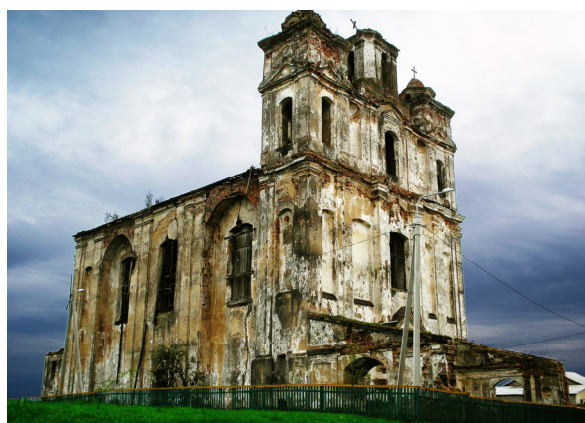
Рис. 1. Костел св. Николая XVIII в. в д. Княжицы Могилевского района (Беларусь)