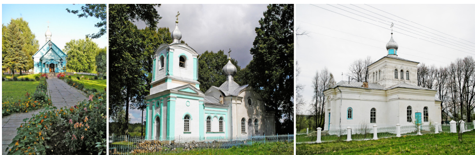
Рис. 2. Примеры организации прихрамовых территорий (слева направо: церковь в честь иконы Божьей Матери «Семистрельная» в д. Ленино Горецкого района, Беларусь; Покровская церковь середины XIX в. в д. Кищицы Дрибинского района, Беларусь; Успенская церковь конца XIX в. в д. Сухари Могилевского района, Беларусь)