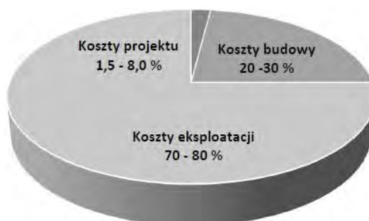
Rys. 3. Udział poszczególnych rodzajów kosztów w całym cyklu życia obiektu

Stosowanie technologii BIM na etapie eksploatacji budynku ma na celu nie tylko usprawnienie procesu zarządzania obiektem, ale również zmniejszenie związanych z tym kosztów. Zaznaczyć należy, że koszty eksploatacji stanowią największą grupę spośród wszystkich wydatków związanych z realizacją i użytkowaniem budynku (rys. 3). Według różnych opracowań sięgają one od 70 do 80% kosztów całkowitych ponoszonych w całym cyklu życia obiektu [6].