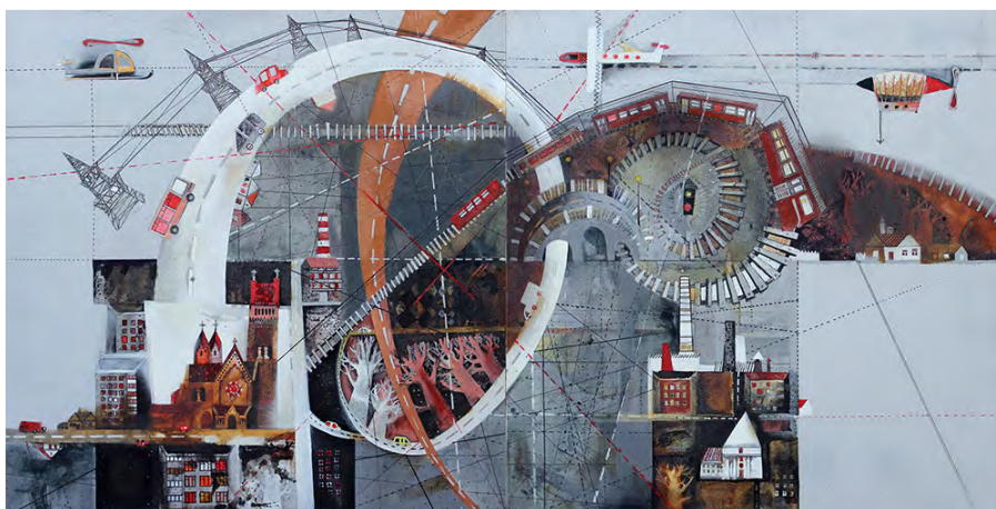
Рис. 7. Д. Бунеева. «Путешествие». Холст, смешанная техника 100x200 см, 2012 г.

Полотно Д. Бунеевой «Путешествие» (рис. 7) разделено на статичные прямоугольники с изображением фрагментов городского пространства, которые объединены динамичными пересекающимися лентами автомобильных и железных дорог. Калейдоскоп городских зданий, памятников зодчества, аэропланов, самолетов, легковых и грузовых автомобилей, спирали дороги с разделительной полосой, светофоров, вагонов метро и ритма шпал железной дороги создает ассоциативный ряд, связанный с передвижением в современном городе и динамикой событий городской жизни.