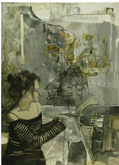
Рис. 3. Н. Разуменко. «Воспоминания. Лошица». Бумага, планшет, смешанная техника, акриловый лак, 40x30 см

В работе «Воспоминания. Лошица» (рис. 3) Н. Разуменко объединяет в единый контекст архитектурные элементы усадьбы в Лошице и предметы повседневного быта, связанные друг с другом воспоминанием. Композиция построена на контрасте хроматических и ахроматических цветов и динамике размещения фрагментов архитектуры и интерьера под углом по отношению к женской фигуре на переднем плане. Мастер ведет речь о двух различных, но пересекающихся пространствах – действительности