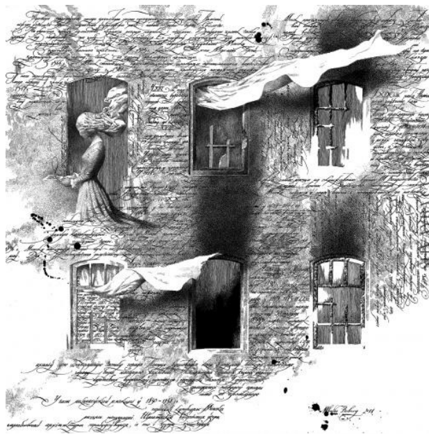
Рис. 5. В. Швайба. «Письмо Минска». Бумага, тушь, перо, 50x50 см, 2011 г.

В толковании В. Швайбы (рис. 5) стены домов старого Минска оберегают множество рукописных отрывков писем, порой неразборчивых и полустертых со следами чернильных пятен и пепла. Это письма-воспоминания самого города и о городе, о событиях его истории от «стародаўняга пасада», который охватывал «схілы ... ногорка за ракой Нямігай...» до пожаров 1809, 1813, 1822, 1835 гг. и «мікалаеўскай рэакцыі 1830–1831 гг.», которые сохранили изгибы старых улиц, камни мостовых и стены домов города. В трактовке художника слова проступают сквозь штукатурку и темные, опаленные пламенем рамы разбитых окон и пустые дверные проемы.