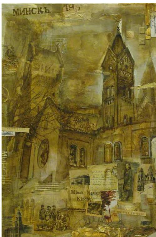
Рис. 4. Н. Разуменко. «Костел Симона и Елены». Бумага, планшет, смешанная техника, акриловый лак, 60х40 см.

В работе «Костел Симона и Елены» (рис. 4) Н. Разуменко, используя метод перекрытия переднего и дальнего планов, разрушает границы городского пространства. Художник формирует смысловую перспективу за счет соединения и наложения на одном листе реальных форм современной архитектуры, изображений давно разрушенных зданий, шрифтов и газетных вырезок начала прошлого века, старинных почтовых открыток с видами города, фотографий, обрывков писем, силуэтов людей, текстур. Мастер создает впечатление об архитектурном объекте как месте, где время и пространство имеют множество вариантов развития.