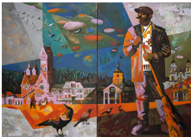
Рис. 6. Д. Бунеева. «Дежурный по осени». Холст, смешанная техника 100x140 см, 2016 г.

и Елены, зданием городской ратуши и Кафедральным собором Пресвятой Девы Марии исчезают. Лучи осеннего солнца оставляют охристо–терракотовый отблеск на облаках, мостовой, крышах и фасадах зданий, яркие пятна на перьях черных городских ворон, метле и одежде дворника, объединяя их в одно целое.