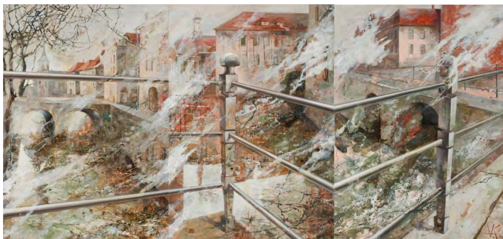
Рис. 1. В. Коваленчикова. «Idem per idem». Холст, масло, 100x210 см., 2007 г.

Вертикали соединений полотен можно трактовать как остановки между разными моментами движения, что создает ощущение выпадения из времени. Это феномен «одновременности неодновременного» (Р. Козеллек).