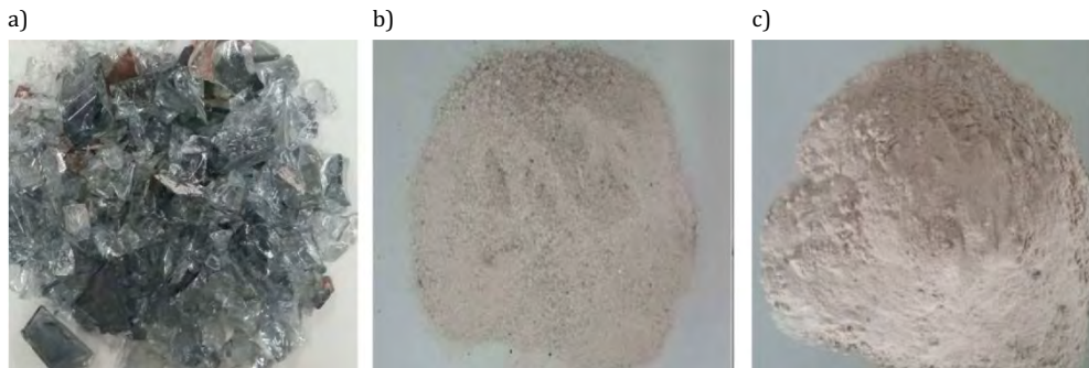
Rys. 1. Rozdrobniona stłuczka szklana kineskopowa: a) wstępnie rozdrobniona; b) zmielona w młynie (B); c) zmielona w młynie i dwukrotnie przemielona w dezintegratorze (A)

Stłuczkę szklaną kineskopową dodano do zaprawy cementowej odpowiednio w ilości 3, 6, 9 i 12% masy cementu, ujmując cement i w ilości 3, 6, 9 i 12% masy cementu, ujmując piasek. Próby wytrzymałościowe na ściskanie i na zginanie oraz badanie nasiąkliwości zostały przeprowadzone na próbkach prostokątnych o wymiarach 40x40x160 mm. Przygotowano serię kontrolną normową oraz 8 serii zapraw modyfikowanych stłuczką szklaną kineskopową CRT. Skład poszczególnych serii przedstawiono w tabeli 1.