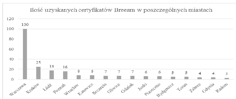
Rys.2. Uzyskane certyfikaty BREEAM w poszczególnych miastach w Polsce [7]

System certyfikacji BREEAM w Polsce jest równie popularny (rys. 1). Jak pokazuje rysunek 2, największa liczba obiektów, które otrzymały certyfikat, znajduje się w Warszawie, tj. około 100 obiektów. Kolejno - Kraków ma 25 certyfikatów i Łódź - 18, a na czwartym miejscu jest Poznań z wynikiem 16 certyfikatów [7].