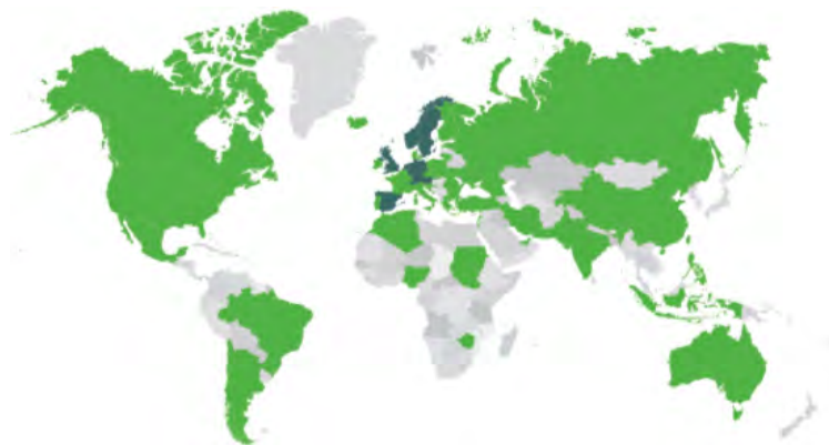
Rys. 1. Certyfikaty BREEAM na świecie [6]

Od 1990 do 2013 roku certyfikat uzyskało około 250 tysięcy budynków. Łączna ilość powierzchni ocenianych we wszystkich kategoriach certyfikacji wynosi 45 000 000 m 2 powierzchni użytkowej biur, budynków handlowych, szkół, zakładów przemysłowych i innych. Na dzień 31.12.2012 r. system ten jest stosowany w niemal 60 krajach na całym świecie [6].