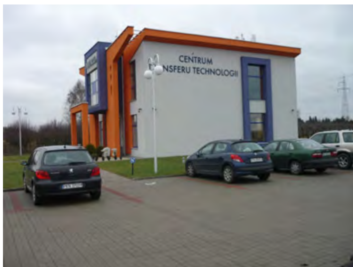
Rys. 4. Budynek oceniany pod kątem certyfikacji BREEAM

W obiekcie zastosowano odnawialne źródła energii, tj.: gruntowy wymiennik ciepła, wentylację z rekuperacją, kolektory słoneczne oraz ogniwa fotowoltaiczne. Ponadto obiekt jest wyposażony w system nawadniania kropelkowego, czujniki opadów deszczu oraz system BMS, który monitoruje produkcję energii w poszczególnych systemach OZE oraz monitoruje zużycie energii. Obiekt został poddany pomiarom szczelności zgodnie z normą PN-EN 13829: 2008 - metoda B, których wynik wynosi 0,7 \text{ l/h} (wynik 0,6 - obiekt pasywny).